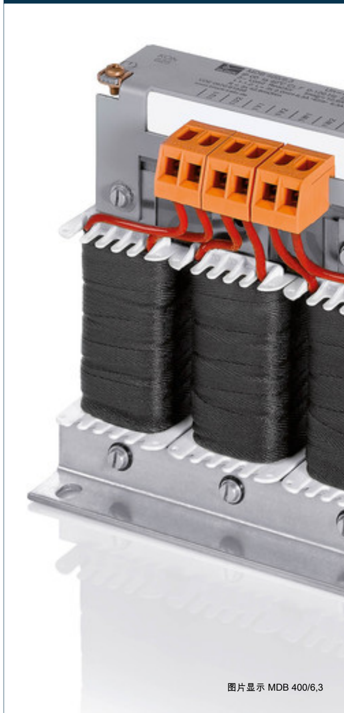
图片显示 MDB 400/6,3