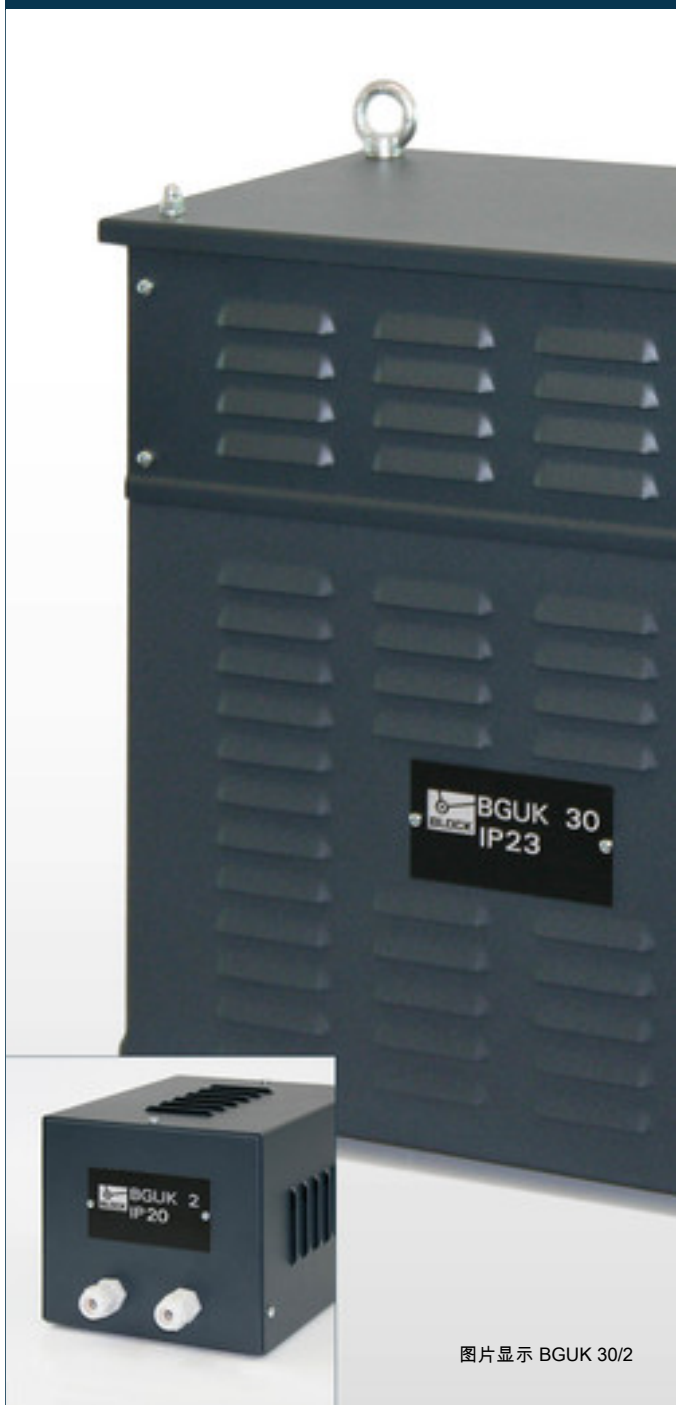
图片显示 BGUK 30/2